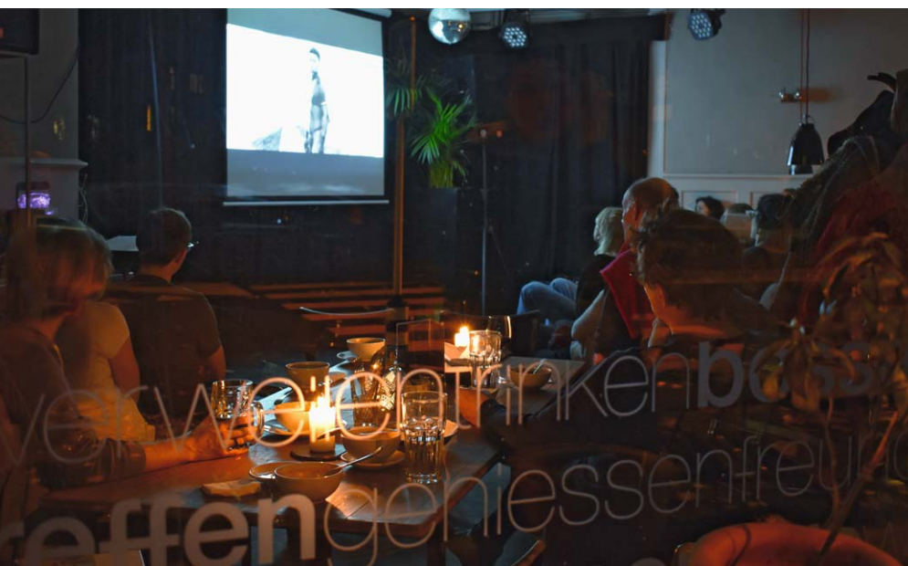
Le Musigbistrot de Berne est organisé en coopérative depuis deux ans.